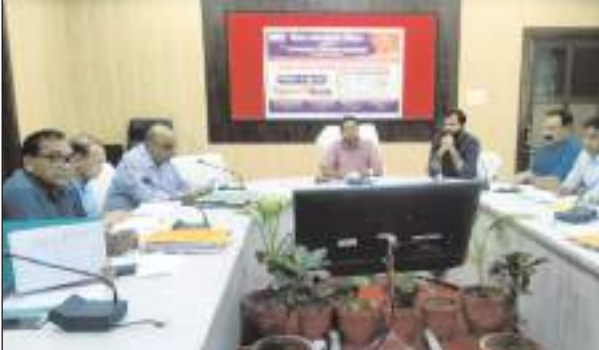
विश्व जनसंख्या स्थिरता परखाड़े की बैठक में मौजूद अधिकारी। अधिकारी कार्यालय, विकास भवन पर दीवार लेखन किया जाएगा। जिलाधिकारी द्वारा आदेशित किया गया है कि इस वर्ष जनसंख्या स्थिरता परखाड़ा में परिवार नियोजन पर विशेष ध्यान देना होगा जिससे विगत वर्ष की भांति जिला इस बार सबसे नीचे ना रहे।

मथुरा/टीम एक्शन इंडिया जनपद विश्व जनसंख्या स्थिरता परखाड़े को सफल बनाने के लिए सोमवार को जिलाधिकारी पुलकित खरे की अध्यक्षता में कलेक्ट्रेट सभागार में अंतर विभागीय बैठक का आयोजन किया गया। बैठक में जिलाधिकारी द्वारा समस्त अधीक्षक को निर्देशित किया गया कि परखाड़े के दौरान सभी आशा कार्यकर्ता के कार्य क्षेत्र में सास बेटा बहु सम्मेलन आयोजित किया जाएगा, पिछले वर्ष जिन आशा कार्यकर्ता ने परिवार नियोजन में अच्छा कार्य किया है उनको जिला अधीक्षारी द्वारा 11 जुलाई को सम्मानित किया जाएगा, एवं उन आशाओं के नाम जिले के समस्त चिकित्सालय एवं जिला