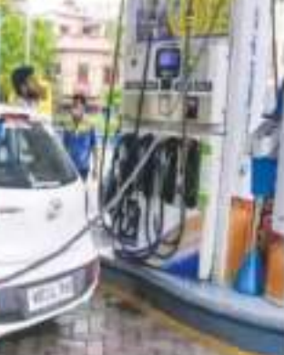
प्रति लीटर की दर पर उपलब्ध है। अंतरराष्ट्रीय बाजार में हफ्ते के दूसरे दिन शुरुआती कारोबार में ब्रेंट क्रूड 0.30 डॉलर यानी 0.40 फीसदी की उछाल के साथ 74.48 डॉलर प्रति बैरल पर ट्रेड कर रहा है। वहीं, वेस्ट टेक्सस इंटरमीडियट (डब्ल्यूटीआई) क्रूड भी 0.35 डॉलर यानी 0.50 फीसदी की बढ़त के साथ 69.72 डॉलर प्रति बैरल पर कारोबार कर रहा है।

इंडियन ऑयल की वेबसाइट के मुताबिक मंगलवार को दिल्ली में पेट्रोल 96.72 रुपये, डीजल 89.62 रुपये, मुंबई में पेट्रोल 106.31 रुपये, डीजल 94.27 रुपये, कोलकाता में पेट्रोल 106.03 रुपये, डीजल 92.76 रुपये, चेन्नई में पेट्रोल 102.63 रुपये और डीजल 94.24 रुपये