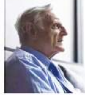
प्रयोगशाला में लंबे समय तक खोज की। तब 1980 में स्मार्टफोन, लैपटॉप और टैबलेट कंप्यूटर के विकास की अनुमति मिली। जीवनरक्षक चिकित्सा उपकरणों में भी उनकी बैटरियों का इस्तेमाल होता है। टेस्ता जैसी कई कंपनियों उनकी बैटरी प्रयोग करती हैं। प्रो. जॉन बी गुडएनफ की बैटरियों का उपयोग कांडिड डिफाइब्रिलेटर जैसे जीवनरक्षक चिकित्सा उपकरणों में भी किया गया है। वैज्ञानिक गुडएनफ को बैटरी पर अपने काम के लिए कभी कोई रॉकरी नहीं मिली। मैसाचुसेट्स इंस्टीट्यूट ऑफ टेक्नोलॉजी, ऑक्सफोर्ड और टेक्सास विश्वविद्यालय में एक वैज्ञानिक और प्रोफेसर के रूप में उन्होंने छह दशक तक सेवाएं दीं। वह वेतन मात्र से गुजार करते रहे। उन्होंने आखिरी समय तक सहकर्मियों के साथ पेटेंट खड़ा किए और अपने पुरस्कारों के साथ आए वजीफे को अनुसंधान और छात्रवृत्ति के लिए दान किया।

न्यूयॉर्क। उग्रदृगज नोबेल पुरस्कार विजेता और लिथियम-आयन बैटरी के निर्माता वैज्ञानिक प्रोफेसर जॉन बी गुडएनफ का देहस्वस के ऑस्टिन में रविवार को निधन हो गया। उन्होंने 100 वर्ष की आयु में दुनिया की अलविदा कहा। वह जानकारी देहस्वस विश्वविद्यालय ने दी। इस विश्वविद्यालय में वह इंजीनियरिंग के प्रोफेसर रहे हैं। प्रो. जॉन बी गुडएनफ को अर्धपूर्व लिथियम-आयन बैटरी, रिचार्जबल पॉवर स्रोत के निर्माण में महत्वपूर्ण योगदान के लिए रसायन विज्ञान में 2019 का नोबेल पुरस्कार दिया गया था। ये स्रोत अधिकांश आधुनिक फोर्टबल इलेक्ट्रॉनिक उपकरणों के साथ इलेक्ट्रिक और हाइब्रिड कारों को शक्ति प्रदान करता है। उन्होंने लिथियम-आयन बैटरी पर ऑक्सफोर्ड विश्वविद्यालय की प्रयोगशाला में लंबे समय तक खोज की। तब 1980 में स्मार्टफोन, लैपटॉप और टैबलेट कंप्यूटर के विकास की अनुमति मिली। जीवनरक्षक चिकित्सा उपकरणों में भी उनकी बैटरियों का इस्तेमाल होता है। टेस्ता जैसी कई कंपनियों उनकी बैटरी प्रयोग करती हैं। प्रो. जॉन बी गुडएनफ की बैटरियों का उपयोग कांडिड डिफाइब्रिलेटर जैसे जीवनरक्षक चिकित्सा उपकरणों में भी किया गया है। वैज्ञानिक गुडएनफ को बैटरी पर अपने काम के लिए कभी कोई रॉकरी नहीं मिली। मैसाचुसेट्स इंस्टीट्यूट ऑफ टेक्नोलॉजी, ऑक्सफोर्ड और टेक्सास विश्वविद्यालय में एक वैज्ञानिक और प्रोफेसर के रूप में उन्होंने छह दशक तक सेवाएं दीं। वह वेतन मात्र से गुजार करते रहे। उन्होंने आखिरी समय तक सहकर्मियों के साथ पेटेंट खड़ा किए और अपने पुरस्कारों के साथ आए वजीफे को अनुसंधान और छात्रवृत्ति के लिए दान किया।