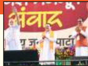
वर्ग ने पसमांदा मुसलमानों का शोषण किया है।

पसमांदा मुस्लिम: इनका शोषण इनके धर्म के एक वर्ग ने किया: पसमांदा मुस्लिम भाई-बहन हैं। वोट बैंक की राजनीति करने वालों ने इनका तो जीना मुश्किल करके रखा है। वे तबाह हो गए, कोई फायदा नहीं मिला। कष्ट में गुजारा करते हैं। उनकी आवाज सुनने के लिए कोई तैयार नहीं। उनके ही धर्म के एक