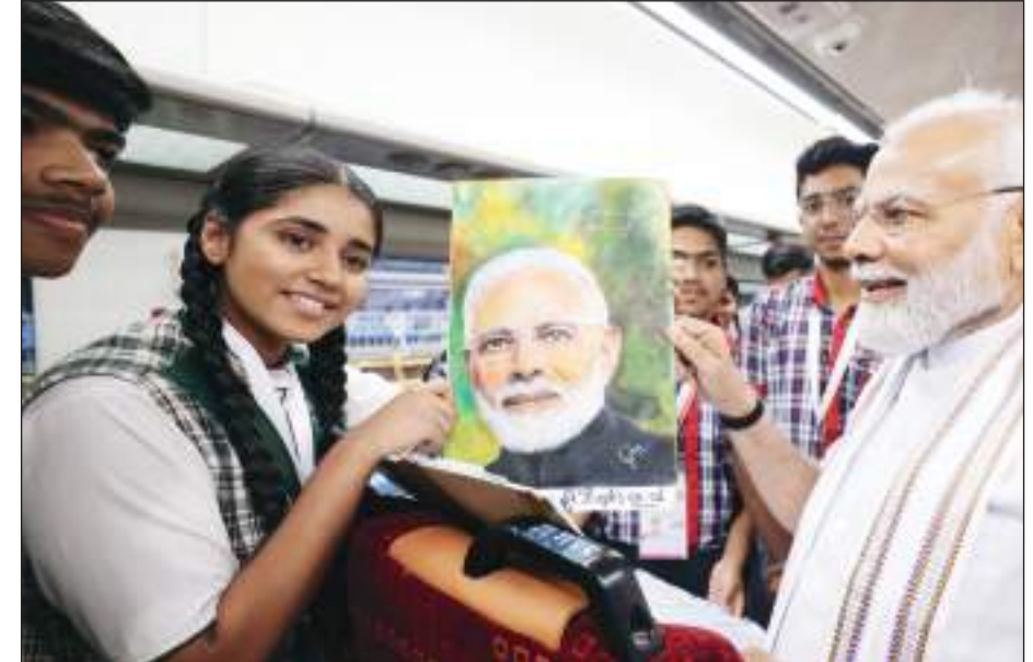
वंदे भारत ट्रेन को हरी झंडी दिखाने से पूर्वी ट्रेन में प्रधानमंत्री नरेंद्र मोदी बच्चों से बात करत हुए और अपना ऑटोग्राफ दिया।

टीएम एक्शन इंडिया/नई दिल्ली दिल्ली के मुख्यमंत्री अरविंद केजरीवाल के आधिकारिक आवास की मरम्मत में हुए खर्च का निर्वचक एवं महालेखापरीक्षक (केए) स्पेशल ऑडिट करेगा। उपराज्यपाल (एलजी) वीके सक्सेना की सिफारिश पर गृह मंत्रालय ने कैंग से स्पेशल ऑडिट करने को मंजूरी दी है। एलजी सचिवालय ने 24 मई, 2023 को मुख्यमंत्री के घर की मरम्मत में हुए खर्च को लेकर गंभीर वित्तीय अनियमितता और नियमों के उल्लंघन का आरोप लगाते हुए गृह मंत्रालय को पत्र लिखा था। इससे पहले 27 अप्रैल को मीडिया रिपोर्ट्स के आधार पर एलजी ने चीफ सेक्रेटरी को मामले में जांच कर तथ्यात्मक रिपोर्ट पेश करने के लिए कहा था।