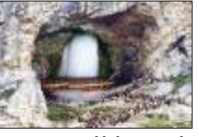
हर संभव सहायता देने के साथ भक्तों को यात्रा के दौरान सर्वोत्तम स्वास्थ्य सेवाएं और चिकित्सा सुविधाएं सुनिश्चित करने के निर्देश दिए।

टीएम एक्शन इंडिया/नई दिल्ली केंद्रीय स्वास्थ्य एवं परिवार कल्याण मंत्री डॉ. मनसुख मांडविया ने मंगलवार को स्वास्थ्य मंत्रालय और डीजीएचएस के वरिष्ठ अधिकारियों के साथ अमरनाथ यात्रा पर जाने वाले श्रद्धालुओं के लिए स्वास्थ्य सेवाओं और पर्याप्त गुणवत्ता वाली स्वास्थ्य सुविधाओं की समीक्षा की। केंद्र शासित प्रदेश जम्मू-कश्मीर को