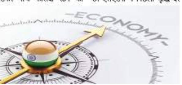
रेटिंग एजेंसी ने एशिया-प्रशांत के लिए जारी अपनी तिमाही आर्थिक समीक्षा में कहा कि हमारा अनुमान है कि भारत, वियतनाम और फिलीपींस की वृद्धि दर लगातार छह फीसदी रहेगी। एजेंसी ने कहा कि घरेलू अर्थव्यवस्था की मजबूती के कारण चालू वित्त वर्ष और अगले वित्त वर्ष के लिए वृद्धि दर के अनुमानों को अपरिवर्तित रखा गया है।

एसएंडपी को चालू वित्त वर्ष 2023-24 में खुदरा महंगाई दर घटकर पांच फीसदी रहने का वृद्धि दर अनुमान 5.5 फीसदी से घटाकर 5.2 फीसदी कर दिया है। एसएंडपी ने पिछली वृद्धि दर