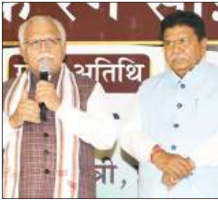
हरियाणा के सीएम मनोहर लाल एक कार्यक्रम को संबोधित करते हुए।