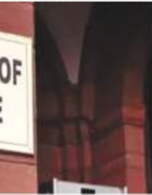
सड़क, पुल और रेलवे सहित विभिन्न क्षेत्रों में पूंजी निवेश परियोजनाओं के लिए दी गई है। मिशन और प्रधानमंत्री ग्राम सड़क योजना के तहत राज्यों का हिस्सा भी दिया गया है।

यह राशि स्वास्थ्य, शिक्षा, सिंचाई, जल आपूर्ति, बिजली, इन क्षेत्रों में परियोजनाओं की गति बढ़ाने के लिए जल जीवन