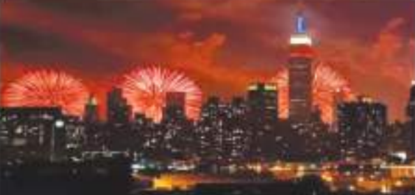
दशक से अधिक समय तक दक्षिण एशियाई और भारतीय-कैरिबियाई समुदाय ने संघर्ष किया है। यह कहते हुए गर्व हो रहा है कि अब दिवाली पर न्यूयॉर्क सिटी के पब्लिक स्कूलों में छुट्टी रहेगी। न्यूयॉर्क सिटी स्कूल के

न्यूयॉर्क। न्यूयॉर्क शहर में रोशन के त्योहार दिवाली पर अब स्कूलों में अवकाश रहेगा। शहर के मेयर एरिक एडम्स ने कहा कि उन्हें गर्व है कि राज्य के सदन और राज्य के सीनेट ने न्यूयॉर्क सिटी के पब्लिक स्कूलों में दिवाली पर छुट्टी रखने संबंधी विधेयक को पारित कर दिया। उन्होंने विश्वास जताया कि गवर्नर इस विधेयक पर हस्ताक्षर कर इसे कानून का रूप देंगे। एडम्स ने कहा यह जीत केवल भारतीय समुदाय के महिला व पुरुषों और दिवाली मनाने वाले सर्व समुदायों की नहीं, बल्कि न्यूयॉर्क की जीत है। इस वर्ष से न्यूयॉर्क शहर के पब्लिक स्कूलों में दिवाली की छुट्टी रहेगी। न्यूयॉर्क की प्रतिनिधि सभा की सदस्य जेनिफर राजकुमार ने कहा कि इसके लिए दो