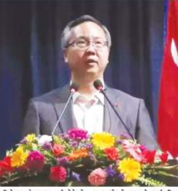
परियोजना के तहत कर्ज लेने से अब इनकार कर दिया है। नेपाल के विदेश मंत्री एनपी सऊद ने सोमवार को सार्वजनिक रूप से स्पष्ट किया कि चीन के बीआरआई प्रोजेक्ट्स को लागू नहीं किया गया है। नेपाली कांग्रेस के वरिष्ठ नेता एनपी सऊद ने चीन के इस दावे को भी खारिज कर दिया जिसमें कहा जा रहा था कि बीआरआई प्रोजेक्ट्स नेपाल में लागू हो चुका है। हालांकि बीआरआई प्रोजेक्ट्स को लेकर नेपाल के प्रधानमंत्री एवं सीपीएम (एमसी) के अध्यक्ष पुष्पकमल दाहल 'प्रचंड' की चुप्पी से भ्रम की स्थिति बनी हुई है। उल्लेखनीय है कि एक जनवरी को पोखरा अंतरराष्ट्रीय हवाई अड्डे के उद्घाटन के दौरान चीनी राजदूत चैन सोंग ने कहा था कि हवाई अड्डे का निर्माण बीआरआई प्रोजेक्ट्स के तहत किया जा रहा है। शनिवार को पोखरा में आयोजित ड्रैगन बोट फेस्टिवल में भी उन्होंने वही बात दोहराई। अब नेपाल के विदेश मंत्री सऊद का मौजूद बयान चीन के इसी दावे का जवाब माना जा रहा है।

काठमांडू। चीन की महात्वाकांक्षी बेल्ट एंड रोड इनिशिएटिव परियोजना (बीआरआई प्रोजेक्ट्स) के तहत दक्षिण एशिया के कई देश चीनी कर्ज में डूब चुके हैं। बीआरआई प्रोजेक्ट्स के तहत चीन की इस खतरनाक लोन डिलीमेंसी का असर श्रीलंका और पाकिस्तान में स्पष्ट रूप से परिलक्षित हो रहा है। इससे सख्त लेते हुए पड़ोसी देश नेपाल ने इस परियोजना के तहत विकास कार्य करवाने के लिए अब और कर्ज लेने से स्पष्ट रूप से इनकार किया है। बीआरआई प्रोजेक्ट्स के तहत चीन से मिलने वाले कर्ज से पाकिस्तान, बांग्लादेश, श्रीलंका और मालदीव में कई परियोजनाएं चल रही हैं। चीन नेपाल में भी बीआरआई प्रोजेक्ट्स को प्रोत्साहन देने के लिए पूरी कोशिश कर रहा है। हालांकि नेपाल सरकार ने इस