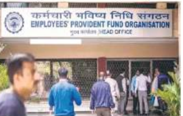
पात्र पेंशनभोगी या सदस्य जिसे केवाईसी अद्यतन करने में समस्या के लिए 'ईपीएफओ' ज़ीएमएस' पर इसकी शिकायत दर्ज कर सकता है।

बढ़ाई गई है। इससे पहले इसे तीन माह से बढ़ाकर 26 जून किया गया था। बयान के मुताबिक किसी भी लिए ऑनलाइन आवेदन जमा करने में कठिनाई का सामना करना पड़ता है, वह तुरंत समाधान