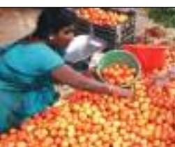
उत्तर प्रदेश, महाराष्ट्र सहित कई राज्यों में टमाटर 2-5 रुपए प्रति किलो बिक रहा था। टमाटर के दामों में आई इस तेजी की वजह भारी बारिश है। बारिश के कारण

टीएम एक्शन इंडिया/नई दिल्ली टमाटर के दामों में अगले एक महीने तक कमी नहीं आने का अनुमान है। अभी देश के ज्यादातर बाजारों में टमाटर की कीमत 100 रुपए प्रति किलो के पार निकल गई है। डिपार्टमेंट ऑफ कंज्यूमर अफेयर्स के मुताबिक अभी केरल के एनाकुलम में टमाटर सबसे महंगा है। यहाँ दाम 113 रुपए प्रति किलो पहुंच गए हैं। एक महीने पहले यानी मई में तो