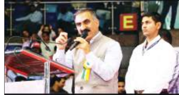
सेवाओं तक पहुंच के संबंध में नागरिकों की बढ़ती आकांक्षाओं के अनुरूप सरकारी विभागों के डिजिटल रुपान्तरण में तेजी लाने के उद्देश्य से राज्य सरकार ने सूचना प्रौद्योगिकी विभाग का नाम